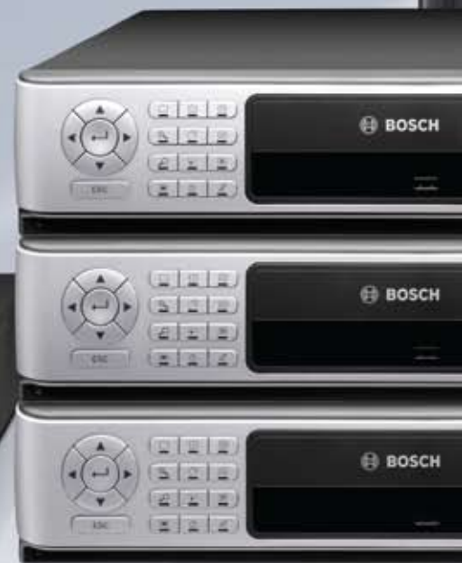
Registratore ibrido e di rete Divar serie 700 2) per applicazioni di sistema complesse