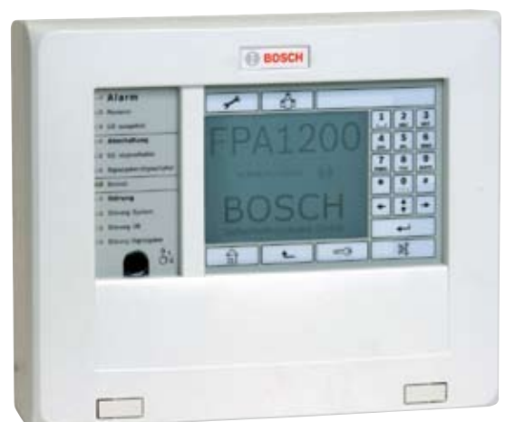
Tastiera remota serie 1200